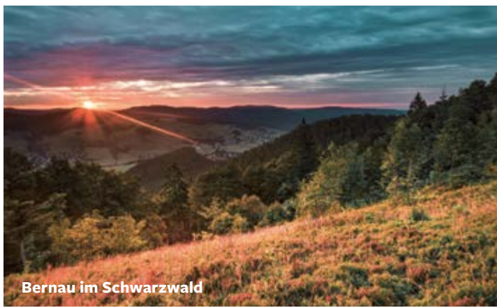
Bernau im Schwarzwald